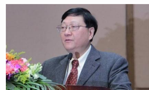
赵曙明：中国人力资源开发研究会副会长，南京大学商学院名誉院长