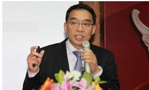
谢克海：中国人力资源开发研究会副会长，北京大学光华管理学院管理实践教授