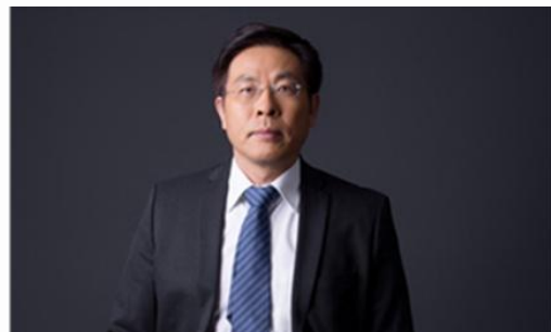
刘辉：中国人力资源开发研究会副会长，百度原高级副总裁