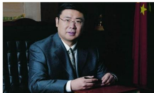
李勇：中国人力资源开发研究会副会长，华永投资集团董事局主席、全国政协委员