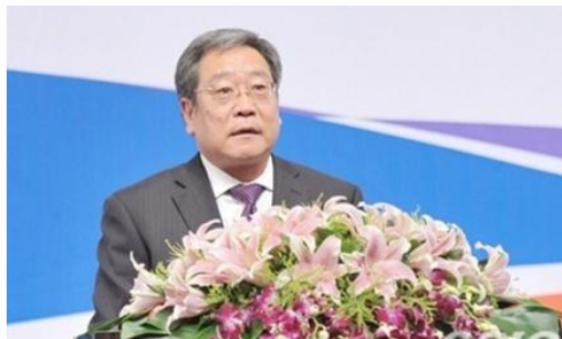
李朴民：中国人力资源开发研究会会长，国家发改委原秘书长