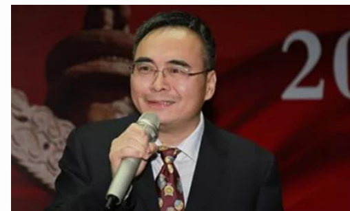
李震：中国人力资源开发研究会副会长兼秘书长