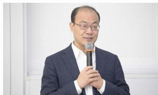
杨伟国：中国人力资源开发研究会副会长，中国人民大学劳动人事学院院长