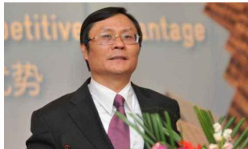
彭剑锋：中国人力资源开发研究会副会长，中国著名企业管理专家