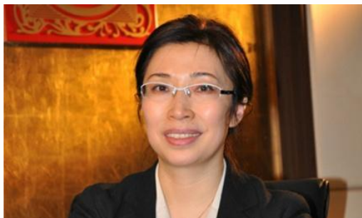
魏秋立：中国人力资源开发研究会副会长，国美控股集团常务副总裁