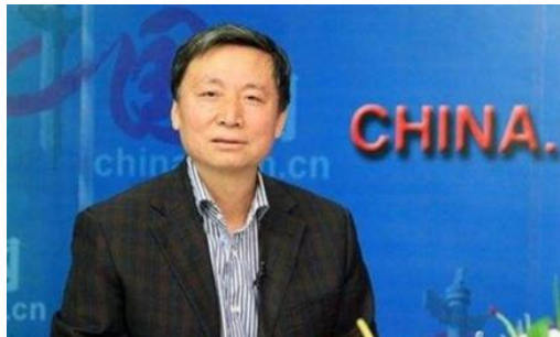
秦玉才：中国人力资源开发研究会会长，国家发改委西部司原司长